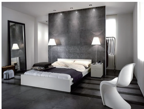
カラースキームをグレーと白でコーディネートし、低い家具を配置することで広くモダンな空間を演出

人の生の1/3を占める睡眠の時間、質の良い眠りを得るための至福のベッドルームを手に入れる方法。さらに、眠るだけではないご自宅の寝室もアイデアしだいで、まるで五つ星ホテルのような、ラグジュアリーホテルのような快適空間に。 まずは、リラクセスできる環境を整えます。ベッドルームに低めの家具を置く事で圧迫感を抑えて空間をより広く見せます。空間に余裕ができれば、