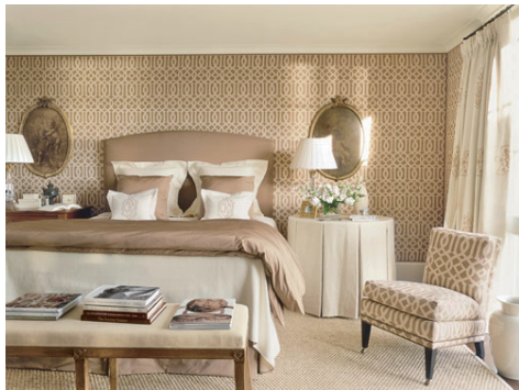
壁紙とサイドチェアのパブリックを一緒にすることで、アクセントをつけると同時にバランスの取れた空間に