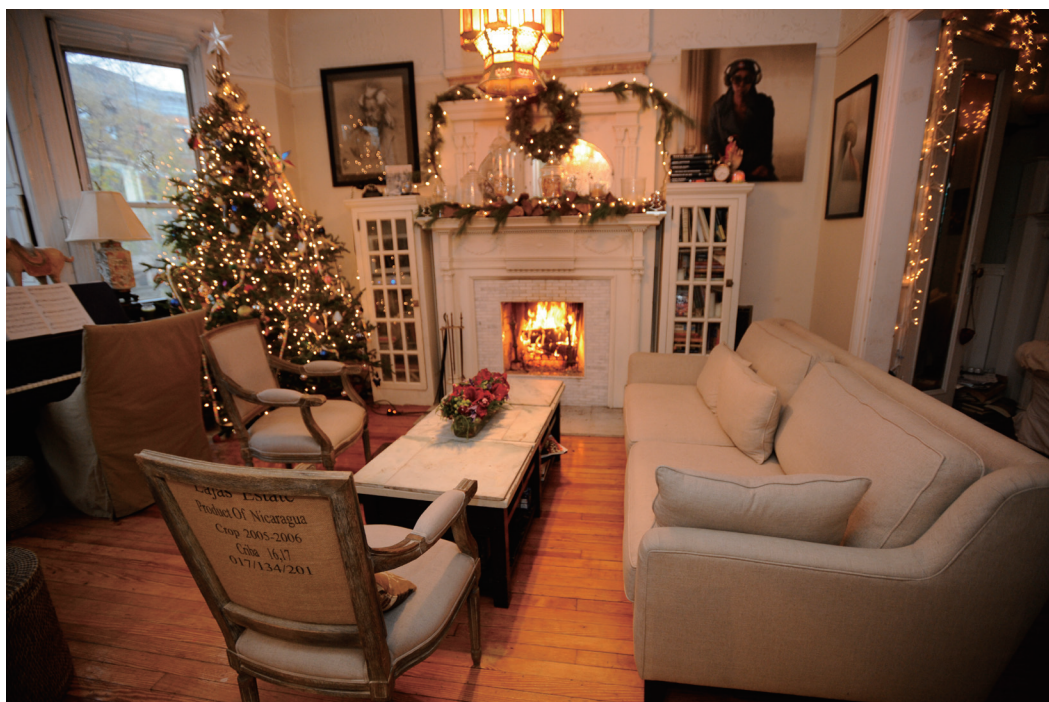
マンションの部屋が狭いとお悩みならば、同じテイストのオーナメントで飾ると統一感が出て素敵。コンパクトな空間のデコレーションのコツです。