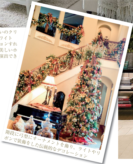
階段に弓型にオーナメントを飾り、ライトやリボンで装飾をした伝統的なデコレーション

オーナメントいっぱいのクリスマスツリーも、ホワイトカラーでデコレーションすれば、控えめで上品な美しいホワイトクリスマスを演出できます。