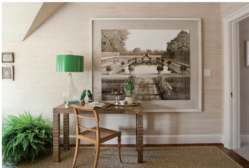
大きな壁面を活かしてデスクの上のアートをフォーカルポイントに。色彩は茶と緑に抑え統一感を出します。

ソファ後ろにソファテーブルを置いた斬新な配置。テーブルはダイニング側のフォーカルポイントに。