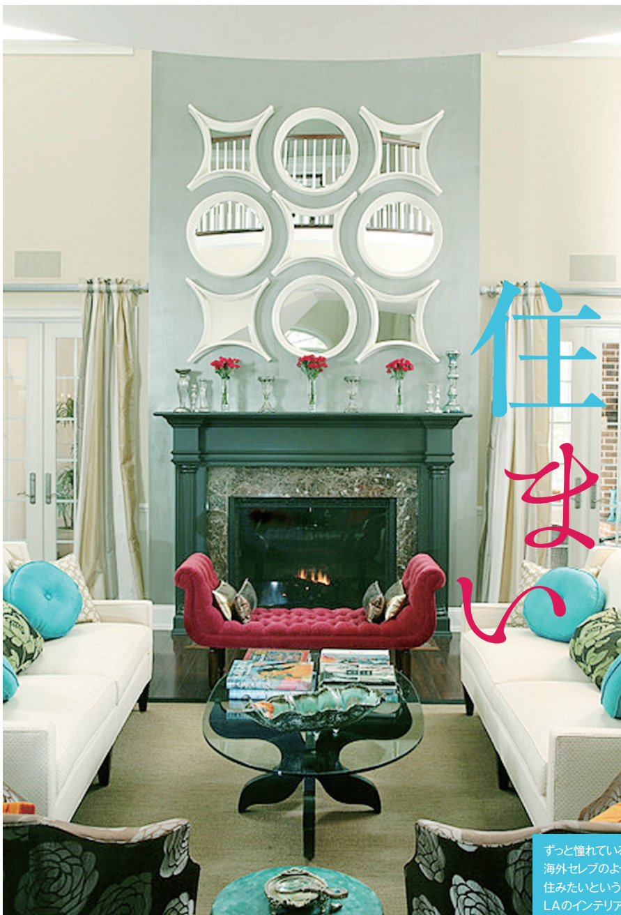
フォーカルポイントとは、部屋を統一させる支配力を持ったポイントのことです。暖炉とミラーがフォーカルポイントになって、醸し出すモダンな雰囲気のリビング。