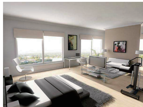
ラグジュアリー (写真左): ラグジュアリーなイメージ 演出は、クラシカルな物を取り入れた空間作りがコツ。 モダン (写真右): シンプルなスタイルでデザイン性に優れたものをコーディネートすると、モダンなイメージに。

自 分の好きなインテリアスタイルがよくわからないという方もいらっしゃると思います。そのような場合には、インテリアを選ぶ前に、まずは自分の好みや、ライフスタイルをしっかりと把握することをお勧めします。普段どんな生活を送っているのか? どんな場所をくつろぐのが心地良いのか? など考えます。ライフスタイルによって選ぶインテリアは変わってきます。例えば、椅子やソファなどに腰掛けるのが心地良いのか、それとも畳や床など低い位置で横になったりする方が心地良いのかなど、日頃の生活を思い起こしてみてください。自分がどのようなライフスタイルを望んでいるのか考えてみましょう。